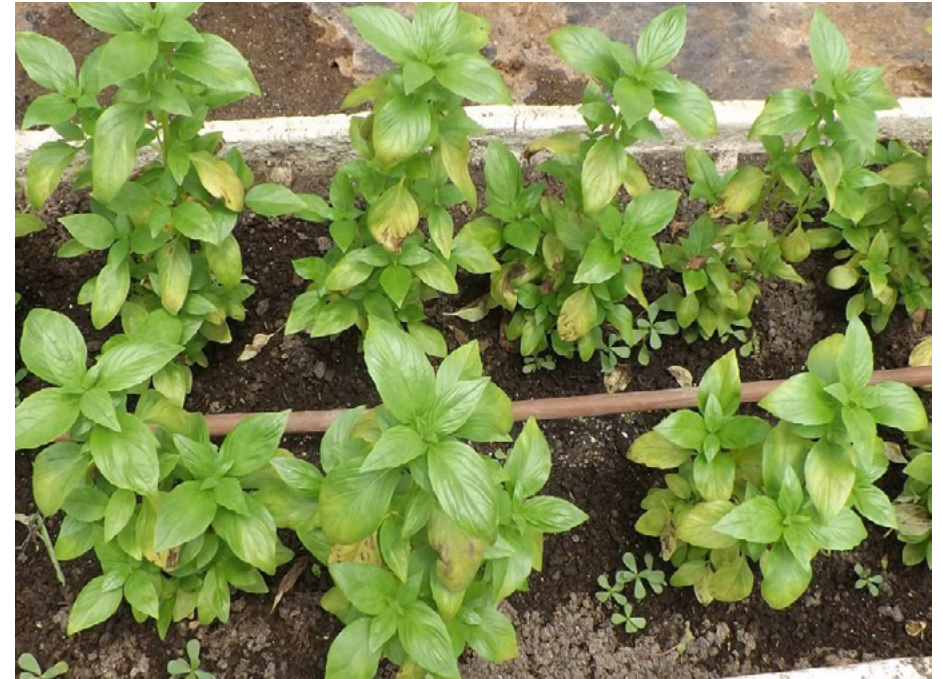
ריחן הבדיל נגוע בכשותית הבזיל, צילומים: דוד סילברמן